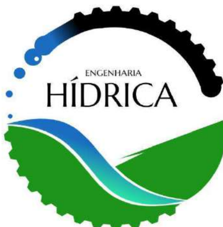
Figura 1 – Logomarca do Curso de Engenharia Hídrica da UFVJM

Como forma de potencializar a imagem do curso perante a comunidade acadêmica e externa, auxiliando na divulgação deste, foi elaborada e votada, por meio de edital específico lançado em 12 de novembro de 2020, a logomarca do curso (Figura 1), a qual apresenta a união de elementos contextualizados com a UFVJM e a Engenharia Hídrica.